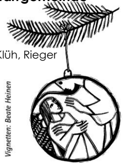
1. Advent: Die Botschaft hören