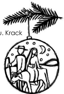
2. Advent: Auf den Weg machen

(Neuhof) 18.30 Uhr Dekanatsabendmesse in St. Michael