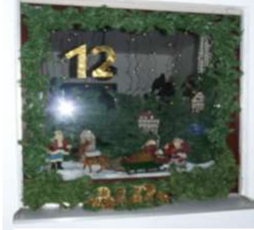
Adventfenster vom 12. Dezember 2013

Die Dorfgemeinschaft Uttrichshausen gestaltete vom 1. - 24. Dezember 2013 einen „lebendigen Adventskalender“. Die liebevoll und fantasie reich geschmückten Fenster der Häuser, vorgetragene Adventgeschichten und vielfältigste köstliche Bewirtung im großen oder kleinen Rahmen, begeisterten jeden Abend ab 18:00 Uhr zahlreiche Besucher an den einzelnen Treffpunkten im Dorf, die vorher dem eigens gedruckten Adventskalender zu entnehmen waren.